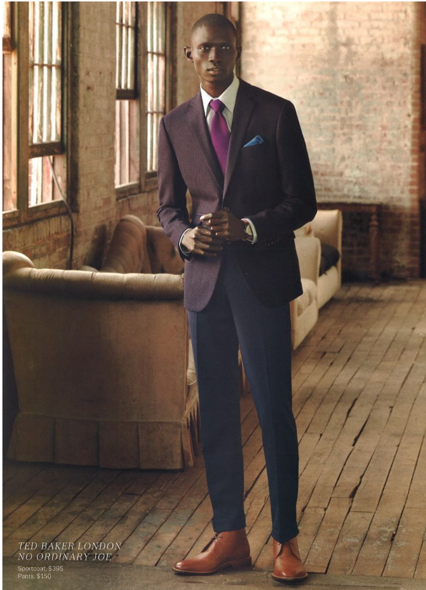
TED BAKER LONDON NO ORDINARY JOE Sportcoat, $395 Pants, $150