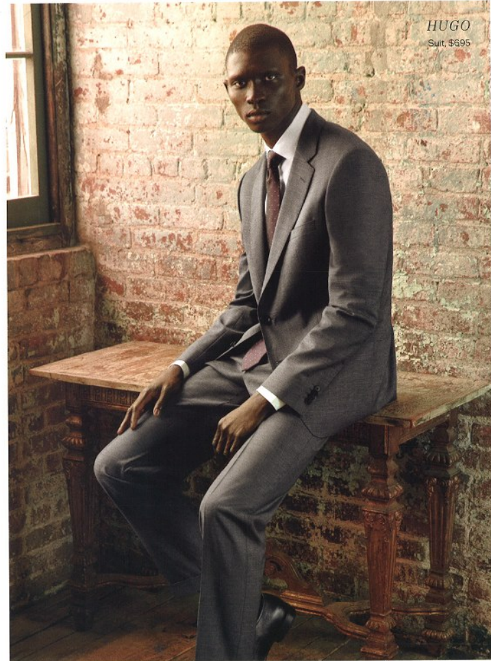
HUGO Suit, $695